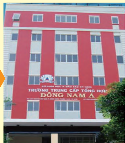
現地提携先 看護大学・専門学校